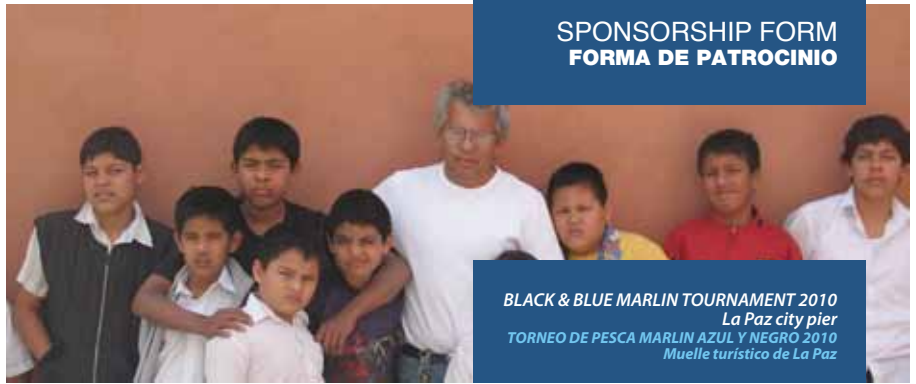
BLACK & BLUE MARLIN TOURNAMENT 2010 La Paz city pier TORNEO DE PESCA MARLIN AZUL Y NEGRO 2010 Muelle turístico de La Paz